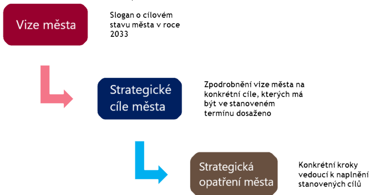
Obrázek 2 Struktura návrhové a implementační části

Strategické vize, programové cíle a strategická opatření jsou dále v tomto dokumentu tříděna dle nadřazených strategických oblastí, respektive prioritních os. Následující schéma zobrazuje přehled prioritních os a strategických oblastí města Mníšek pod Brdy pro období 2018-2028. Z níže uvedeného je zřejmé, že se Strategický plán opírá o čtyři prioritní osy, resp. rozvojové oblasti města Mníšek pod Brdy, a to o Školství, kulturu, sport a cestovní ruch, Bydlení, sociální a zdravotní služby, bezpečnost, Životní prostředí a Dopravu a infrastrukturu.