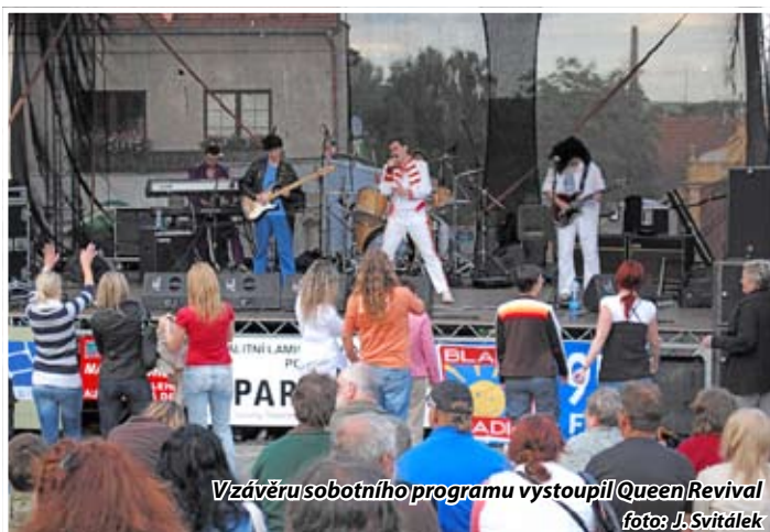
V závěru sobotního programu vystoupil Queen Revival