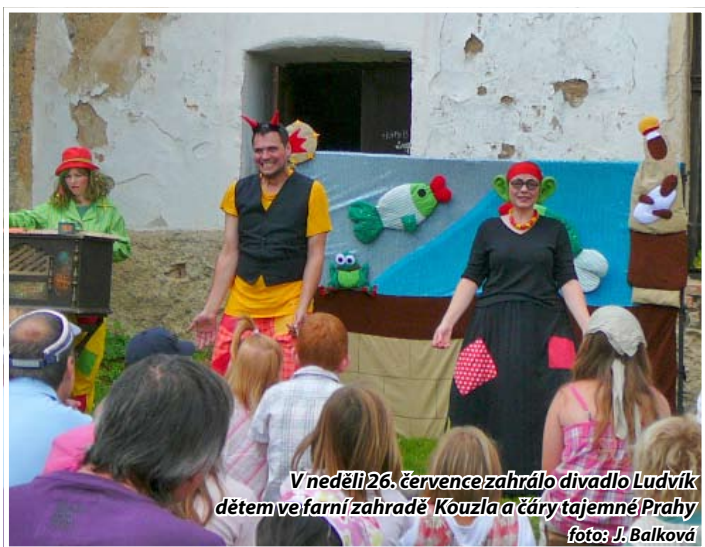
V neděli 26. července zahrálo divadlo Ludvík dětem ve farní zahradě 'Kouzla a čáry tajemné Prahy'