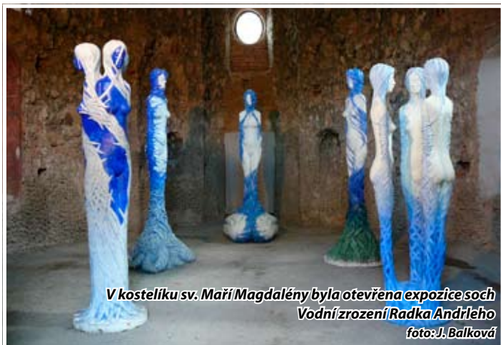
V kostelíku sv. Maří Magdalény byla otevřena expozice soch Vodní zrození Radka Andrlého