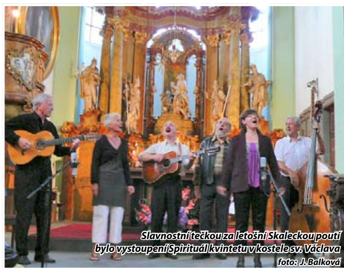
Slavnostní tečkou za letošní Skaleckou pouť bylo vystoupení Spirituál kvintetu v kostele sv. Václava