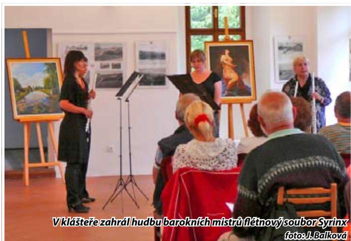
V klášteře zahrál hudbu barokních mistrů flétnový soubor Syrinx