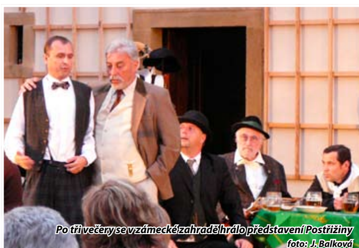
Po tři večery se v zámecké zahradě hrálo představení Postřiziny