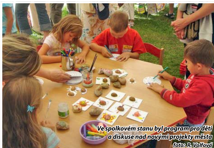
Ve spolkovém stanu byl program pro děti a diskuse nad novými projekty města