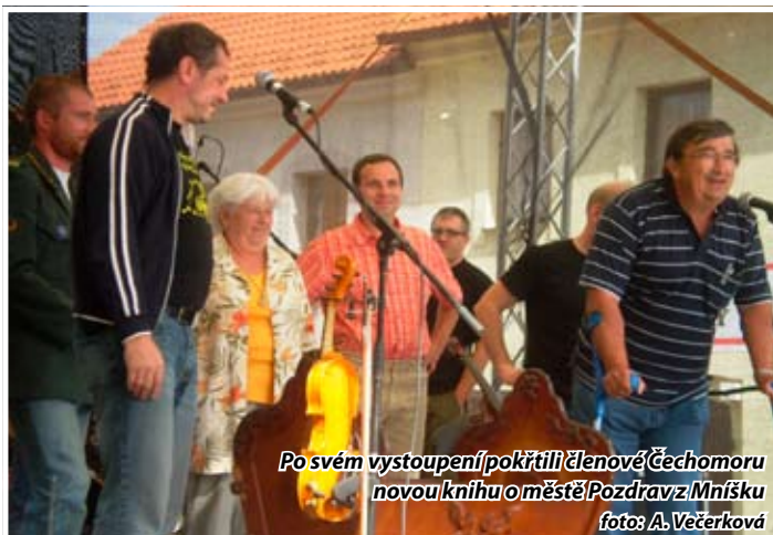
Po svém vystoupení pokřtili členové Čechomoru novou knihu o městě Pozdrav z Mníšku