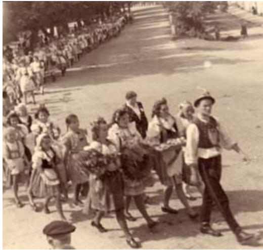
...nevíme, kdy a kde byla pořízena tato fotografie

Milí čtenáři, ke 100. výročí ustavení Sokola v Mníšku pod Brdy přinášíme výběr dokumentárních fotografií z historie této organizace. Omluvte laskavě zhoršenou kvalitu některých z nich.