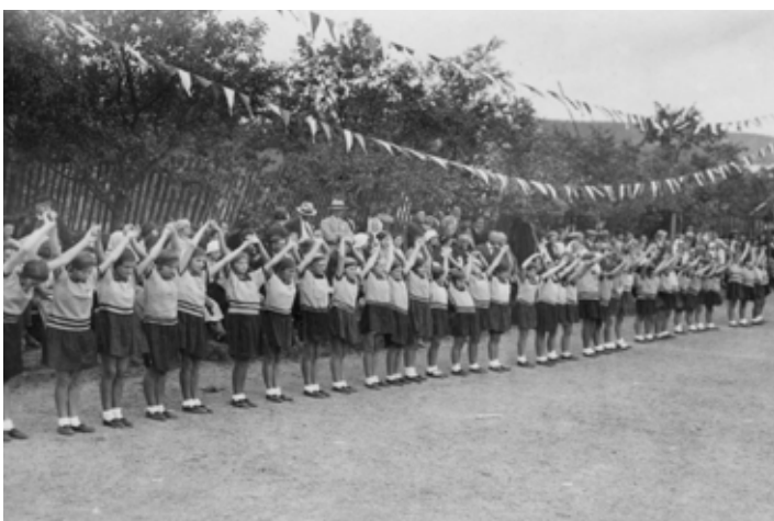
Cvičení žactva TJ Sokol Mníšek pod Brdy