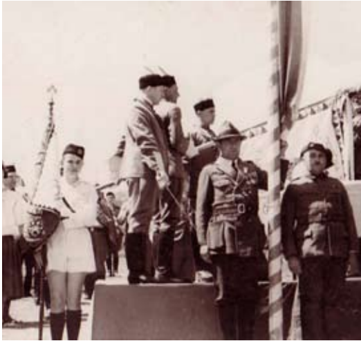
Kdo je na této fotografii, nevíme...