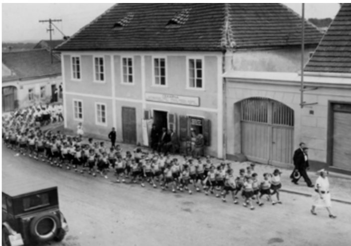
Průvod Malých cvičenců vstupuje na náměstí z Pražské ulice. Dům na snímku již neexistuje (v jeho místě je dnes vietnamský obchod). Na ceduli na domě je nápis: Čekárna autobusové trati Praha – Mníšek – Dobříš.