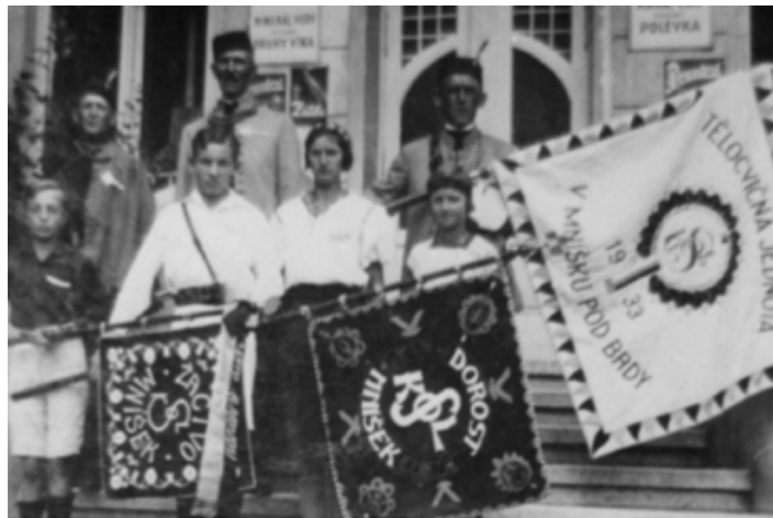
Předání praporů TJ Sokol Mníšek 1935 na schodech sokolovny