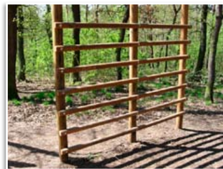
Neleníme v zeleni - žebřiny