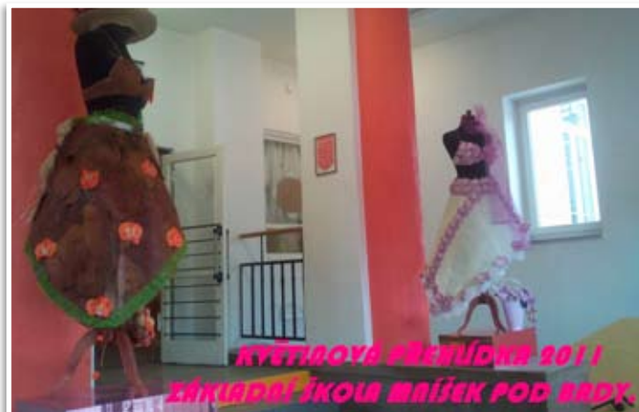
KVĚTINOVÁ PŘEHÍDKA 2011 ZÁKLADNÍ ŠKOLA MNÍŠEK POD BRDY