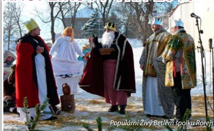
Populární Živý Betlém spolku Rorejs

Knoflíkovému trhu na náměstí F. X. Svobody počasí letos přálo více než loni. Po ránu bylo mrazivo, ale k polednímu vysvitlo sluníčko a zahřálo děti i dospělé za prodejními stolky, malé i velké zpěváky, aktéry tradičního Živého Betléma i všechny ty, kdo přišli na mníšecké náměstí F. X. Svobody, aby si užili krásné předvánoční atmosféry. Mohli zde koupit svým blízkým dáreček vyrobený šikovnými dětmi, něco dobrého na zub a třeba i balónek štěstí, který si pak většina z nich přišla vypustit 30. prosince opět na náměstí F. X. Svobody v rámci akce „Předčasný Silvestr“.