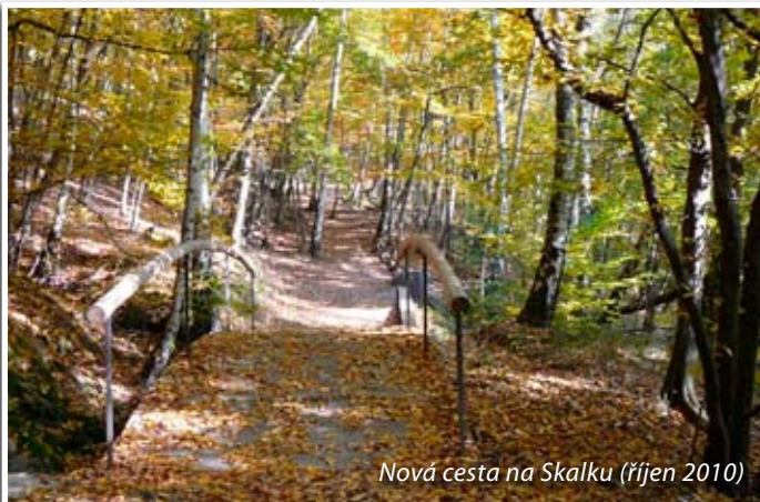
Nová cesta na Skalku (říjen 2010)

Živá hudba, ohňostroj, svažené víno, balóčky štěstí... Náměstí F. X. Svobody