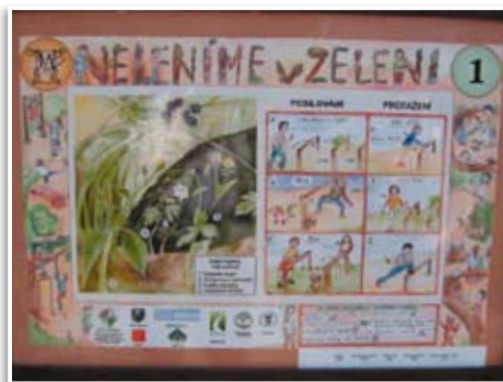
Tělocvičná stezka Neleníme v zeleni, Praha 4-Kamýk