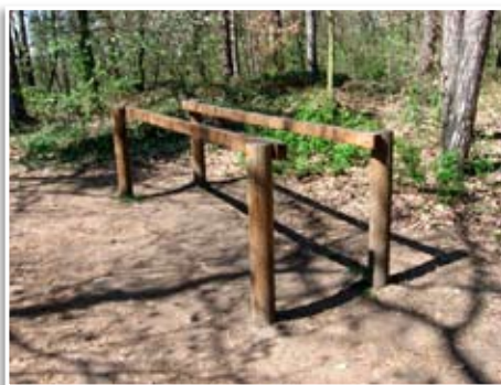
Neleníme v zeleni - bradla