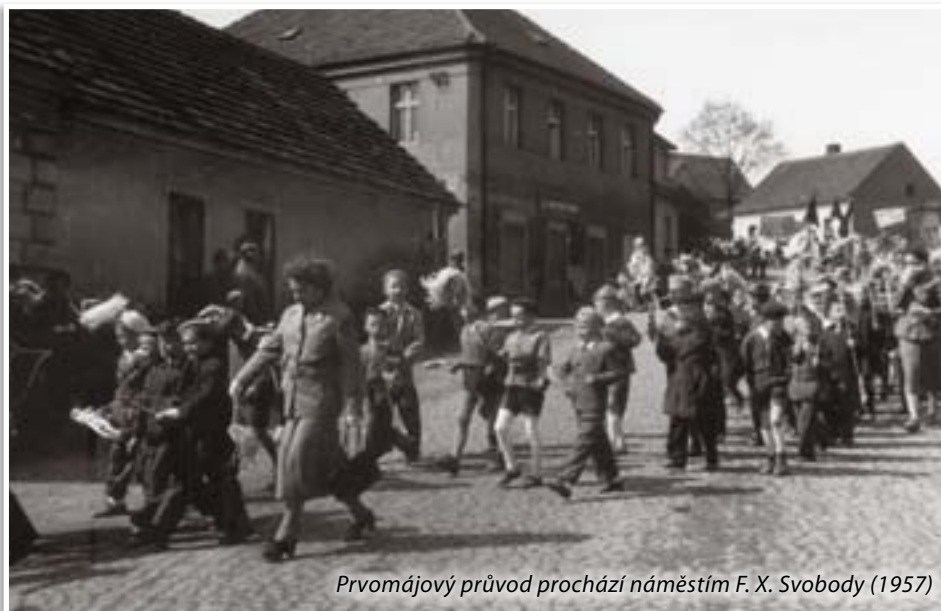
Prvomájový průvod prochází náměstím F. X. Svobody (1957)

Jak už jsem se zmínil, podhůří brdských Hřebeňů bylo vyhledávaným cílem trampů. Dnes už fenomén trampingu málokoho oslovuje. Moderní doba se svými vymoženostmi už neevokuje romantiku pobytu v přírodě, dnešní mladí lidé nemají potřebu unikat o víkendech z ruchu velkoměst do konejšivého ticha lesů. Autentičtí trampové jsou už jen exotickou zvláštností. Bývalé trampské osady se proměnily v chatová satelitní města se vším komfortem. Staří trampové jsou už na nocování pod širákem skutečně staří, dorost chybí, maximální úlitbou trampskému pánuobohu je účast příznivců trampské muziky na různých country a folkových festivalech. Ale i obliba tohoto typu muziky se limitně blíží nule. Já ještě pamatuji trampské party, které přijížděly v sobotu odpoledne (dopoledne se ještě pracovalo) bránickým pacifikem na mnišecké nádraží a odtud vyrážely do trampských kempů na Hřebenech.