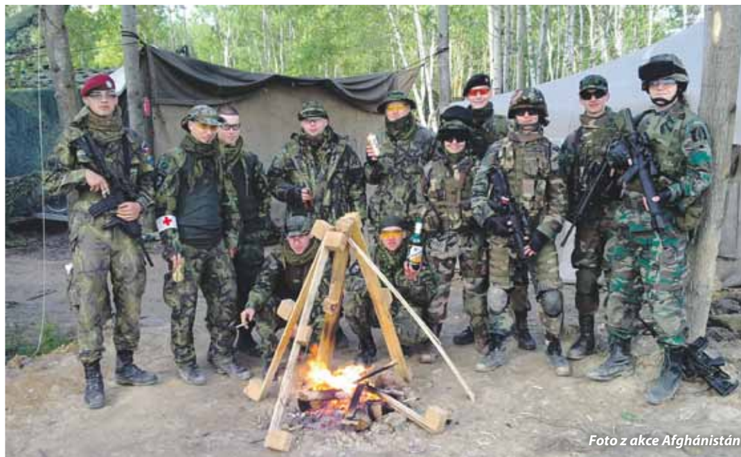
Foto z akce Afghánistán

Již třetím rokem jsme byli pozváni na výběrovou akci Afghánistán 2012 v Milovicích. Patří jak velikostí herního pole, tak i počtem hráčů mezi největší v republice. Akce je spíše simulací bojového konfliktu, opravdu se všim všudy. Náš tým hrál za stranu NOTO – našimi úkoly bylo chránit obyvatelstvo domorodých vesnic před nájezdy horských kmenů. Dále jsme měli pátrat po výcvikových táborech a varnách opia a v poslední řadě bránit naše základny. Byli jsme pozváni týmem DARON na jejich nedobytnou základnu NORAD. Základnu bránilo cca 70 mužů a jedna žena. V průběhu dvou dní a dvou nocí na akci jsme zažili sabotážní mise, noční přepady, kontroly domorodých vesnic a rutinní denní patroly okolo naší předsunuté základny. V posledních hodinách bojů se nepřátelé