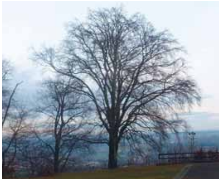
Fotografie Anny Čiškové