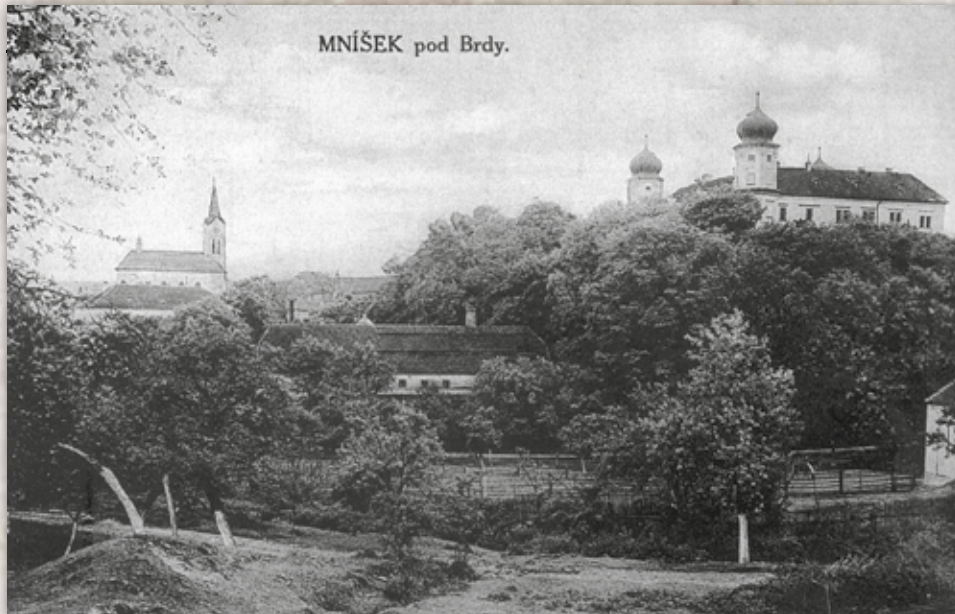
MNÍŠEK pod Brdy.