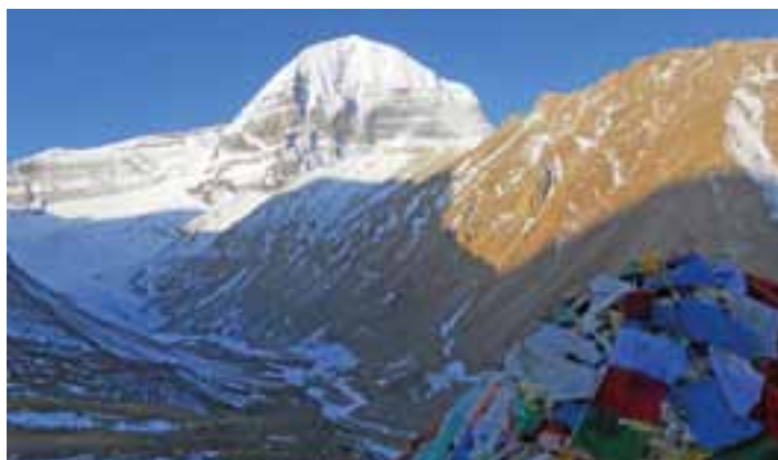
Fotografie Jaroslavy Pokorné