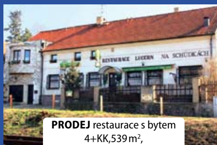
PRODEJ restaurace s bytem 4+KK, 539 m 2 , Dobřichovice Praha-západ