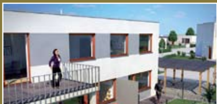
Byt, 4+kk , 117 m 2 , zahrada, parkování, cena vč. DPH: 4.132.500 Kč.