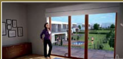
Byt, 3+kk , 63 m 2 , zahrada, parkování, cena vč. DPH: 2.755.000 Kč.