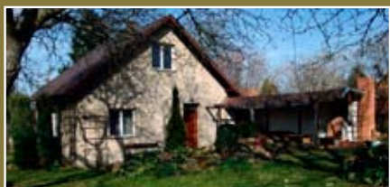
Zděná chata 3+kk , po část. rekonstrukci, pozemek 1 428 m 2 , Mníšek. Cena: info v RK.