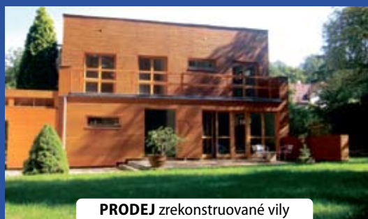
PRODEJ zrekonstruované vily 6+kk/G 240 m 2 , Březová-Oleško