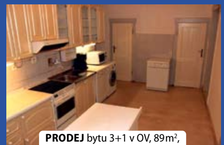
PRODEJ bytu 3+1 v OV, 89m 2 , ul. Mahenova, Praha 5 - Košíře