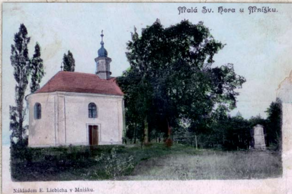
Kaple na pohlednici zr. 1902