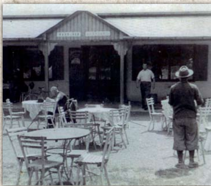
Restaurace p. Tellingera po 2. světové válce