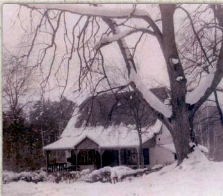
Zasněžená hospoda (kolem r. 1952)