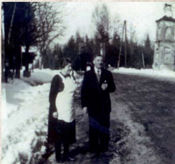
Staří Tellingerovi – vpravo Boží muka poblíž kaple, barokní patrový hranolový pilíř s pilastry, ukončený stanovou střechou