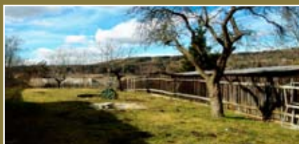
Pozemek 682 m 2 , v blízkosti centra Mníšku, IS na hranici pozemku. Cena: 2.150.000 Kč.