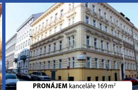
PRONÁJEM kanceláře 169 m 2 v 1. NP, ul. Římská, Praha 2 - Vinohrady