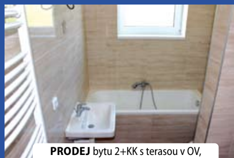
PRODEJ bytu 2+KK s terasou v OV, 65 m 2 , ul. Karlštejská, Lety u Dobřichovic