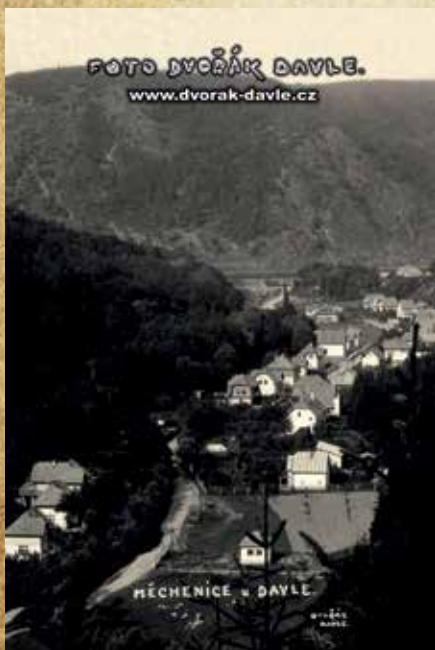
Měchenice na dobové fotografii