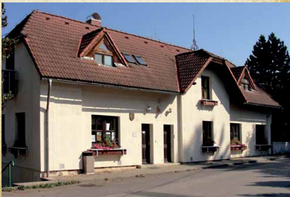
Budova obecního úřadu