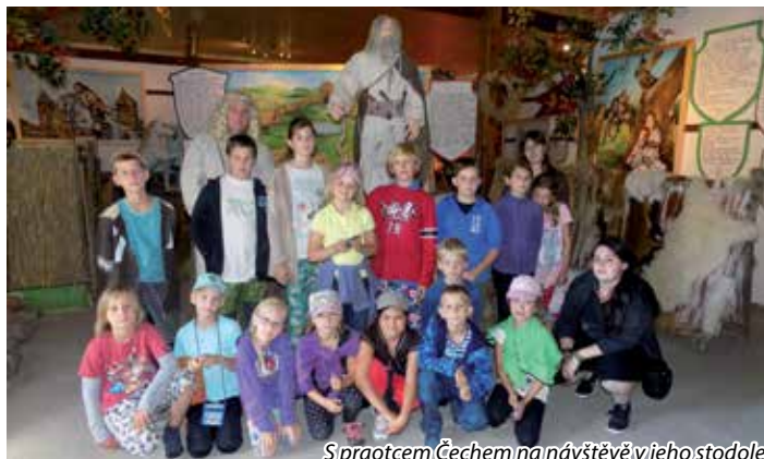
Spraotec Čechem na návštěvě v jeho stodole

Ve čtvrtek nás čekalo přespání v knihovně. Ještě před tím jsme vyšli na Skalku, kde jsme si opekli buřty a kam nás přijeli navštívit muzikanti, aby si s námi zahráli a zazpívali u ohně. Když se setmělo, děti ještě šly kouzelnou cestu lesem, na jejímž konci čekala odměna. Potom jsme se vydali spinkat do knihovny. Další den jsme hráli maňáskové divadlo a pak následovalo vyhodnocení etapové hry. Protože všichni byli velice šikovni, každý si domů odnesl zajímavou odměnu.