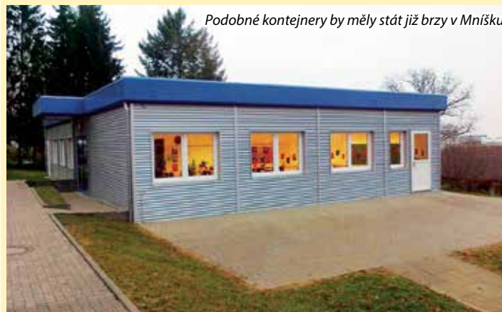
Podobné kontejnery by měly stát již brzy v Mníšku

budu skříňky. Děti budou do doby dokončení v náhradních učebnách v budově školy. Rodiče těch prvňáčků, kterých se to týká, dostali e-mailem informaci od paní ředitelky a také od třídních učitelů.