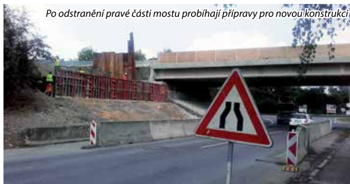
Po odstranění pravé části mostu probíhají přípravy pro novou konstrukci

Kompletní ceník najdete na webu města www.mniksek.cz v sekci Kam s odpadem.