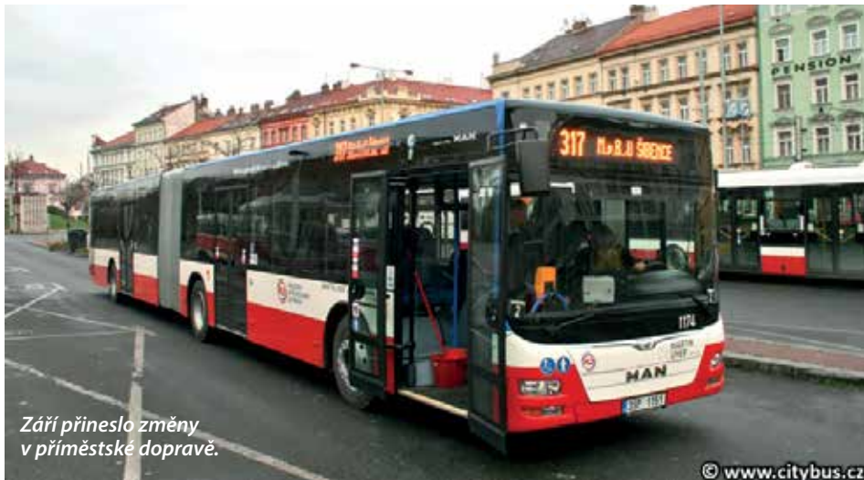
Září přineslo změny v příměstské dopravě.