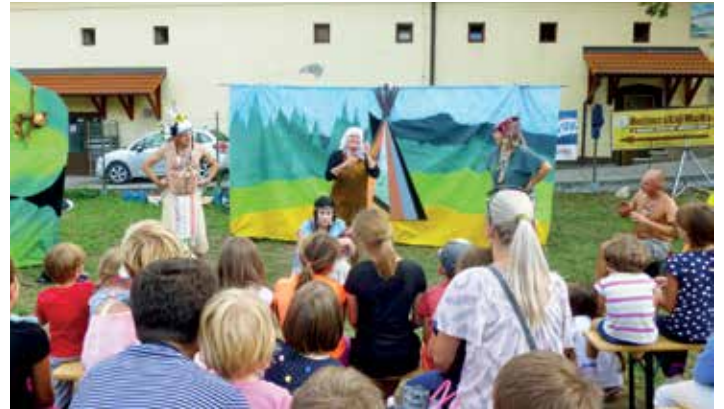
Karlovarské divadlo D3 dětem předvedlo svoje představení Čučudejské pohádky jako zábavnou variaci na notoricky známé pohádkové příběhy.