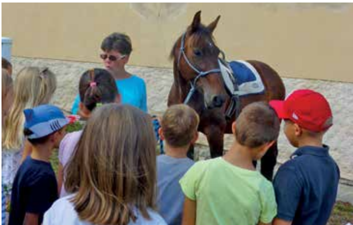
Stáj Hanky Kotoučové nabídla projížďky na koních a děti je krmily připravenou mrkví a jablčky.