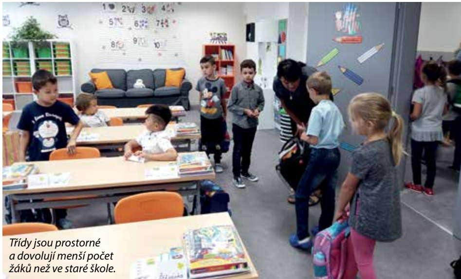
Třídy jsou prostorné a dovolují menší počet žáků než ve staré škole.

M ezi zhruba sto deseti tisíci dětmi, které minulý měsíc po celé republice poprvé usedly do školních lavic, byla i více než stovka prvňáčků mníšecké Základní školy Komenského 420.