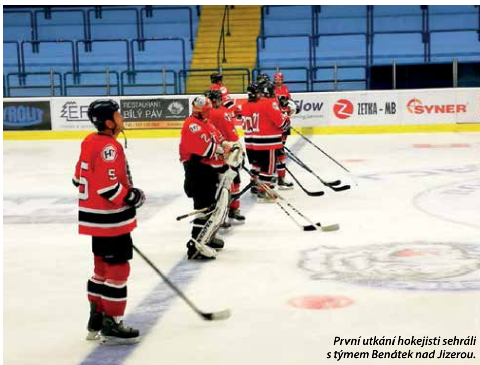
První utkání hokejisti sehráli s týmem Benátek nad Jizerou.

H okejisté HT Mníšek pod Brdy vyhráli Meziokresní přebor a po postupu zahájili nadcházející sezonu 2018/2019 ve skupině sever Krajské soutěže.