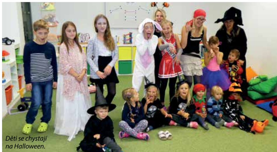
Děti se chystají na Halloween.

Dětská skupina Koumáci, sídlící v areálu UVR, je alternativní formou péče o děti od 1 roku do 6 let. Učí se hrou i vlastním prožitkem a podnětů mají opravdu hodně. Tak například tento měsíc budou mít Halloween. Přijďte se pobavit s námi!