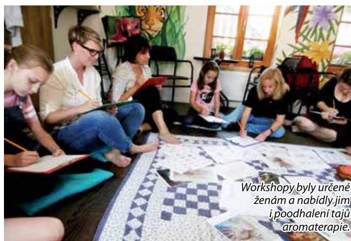
Workshopy byly určeny ženám a nabídly jim i podhalení tajů aromaterapie.

Spolek Brdský šikula má sice svůj název v mužském rodě, ale nabízí i aktivity ryze ženského druhu.