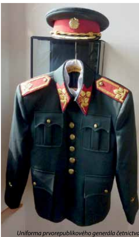
Uniforma prvorepublikového generála četnictva

Na stěně budou rozvěšené zajímavé mapky zachycující rozsah opevnění na linii takzvané Pražské čáry, která vedla právě i okolím Mníšku. Z oken věže uvidí návštěvníci přesným směrem tam, kde se takzvané řopíky i jiné typy opevnění budovaly.