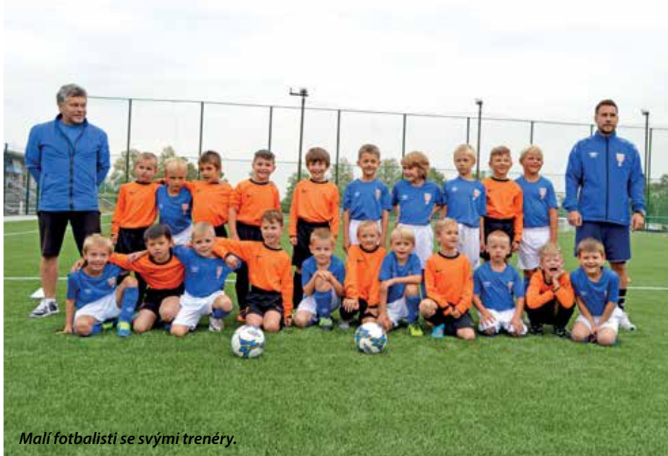
Malí fotbalisti se svými trenéry.

Hřiště má rozměry 50x40 metrů, umělé osvětlení, oplocení a zastřešené střídačky a FK Mníšek a volnočasové aktivity dětí v něm získaly důstojné prostředí pro tréninky i zápasy.