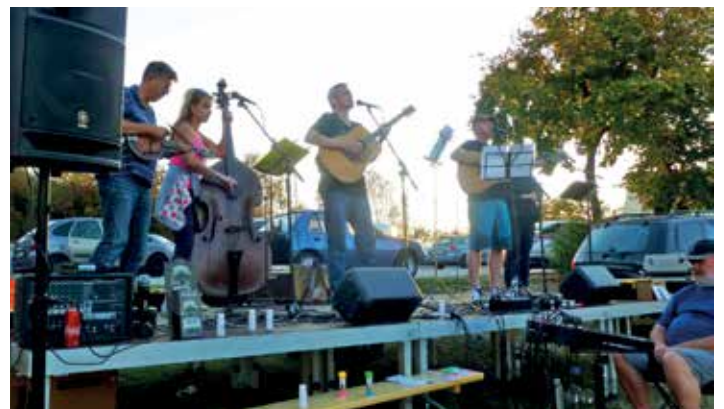
Tečku za odpolednem vytvořila folková kapela Pražec.