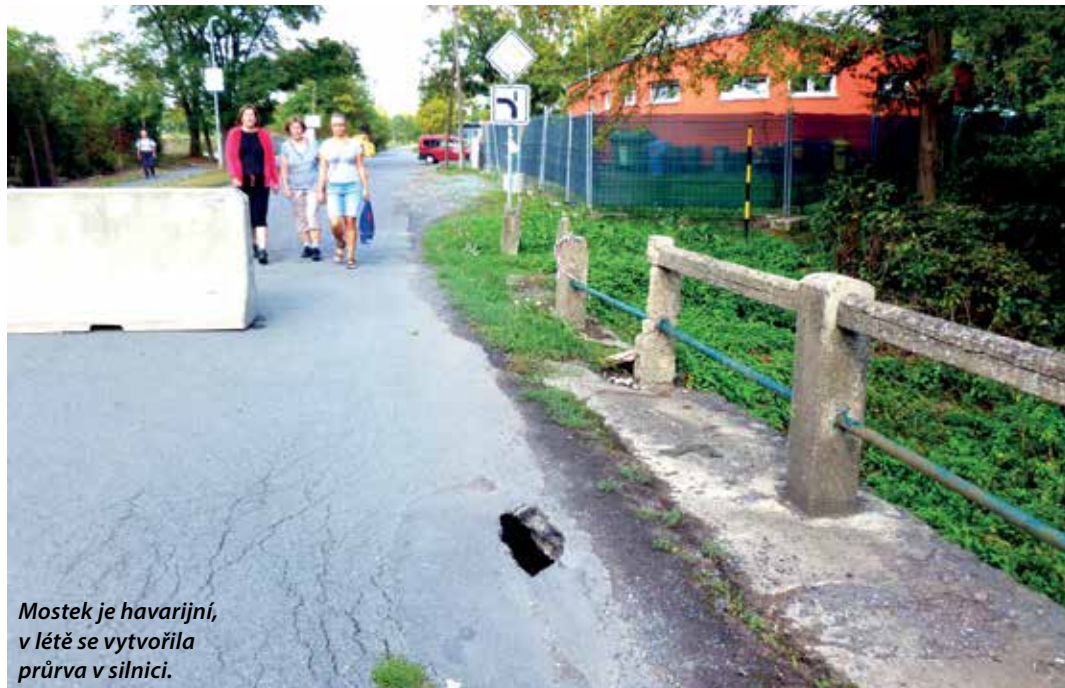
Mostek je havarijní, v létě se vytvořila průrva v silnici.