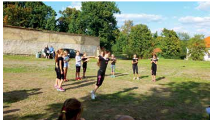
Program zpestřila pohybová vystoupení dětí ze spolku Bios Fit.