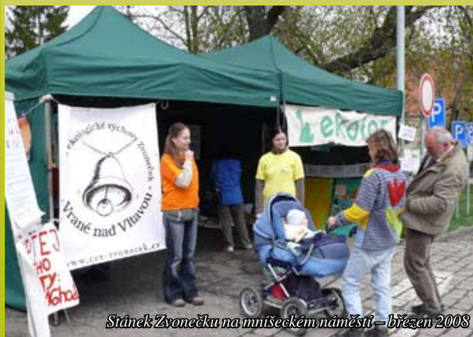
Stánek Zvonečku na mníšeckém náměstí – březen 2008