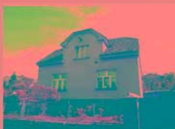
Prodej RD 4+1, zahrada 1100 m2 v Novém Kníně, cena 2280000 Kč