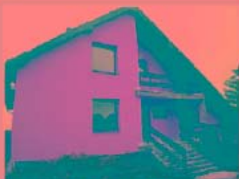
Pronájem RD 6+1 po luxusní rekonstrukci. Nájemné 19.000,- Kč měsíčně + inkaso

tradice, zkušenosti, spolehlivost, profesionalita jsme nejbliže Vaším nemovitostem