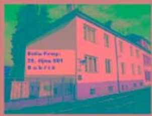
SKS-Dobříš, spol. s r.o. 28. října 661, Dobříš 263 01