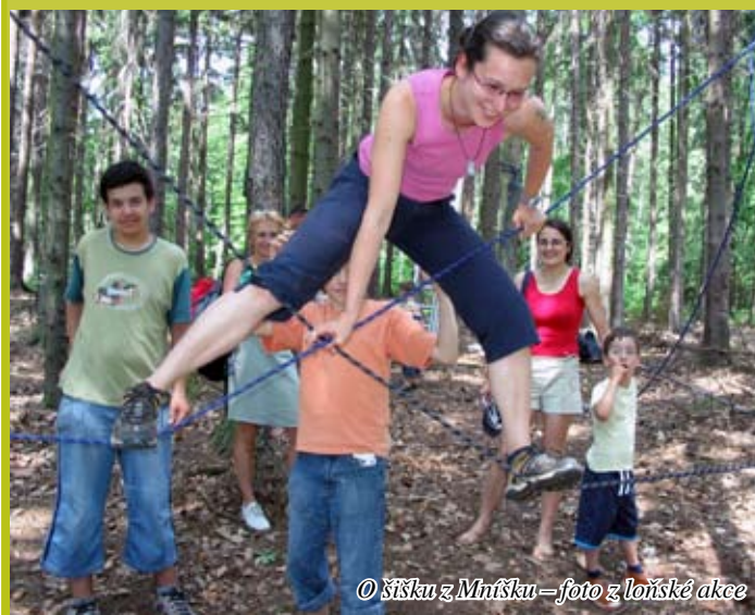
O šišku z Mníšku – foto z loňské akce