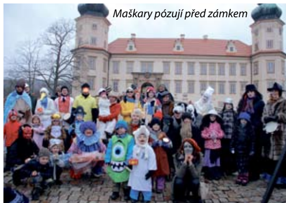
Maškary pózuji před zámkem