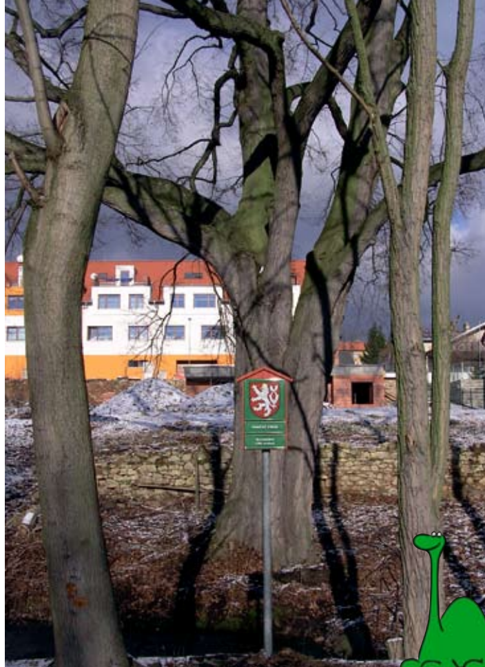
Nový památný strom – lípa na Pivovárce