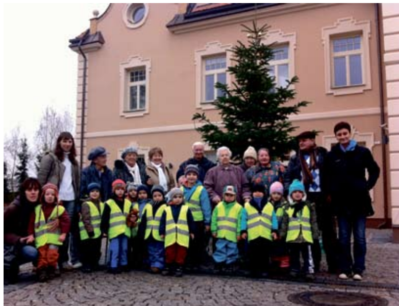
Ze společného výletu seniorů a dětí na zámek Berchtold

Měsíc prosinec byl velmi bohatý a pestrý na program nejen pro děti, ale i jejich rodiče. Sešli jsme se u zdobení vánočního stroměčku na náměstí, na besídkách a dvě prosincová dopoledne u tvoření