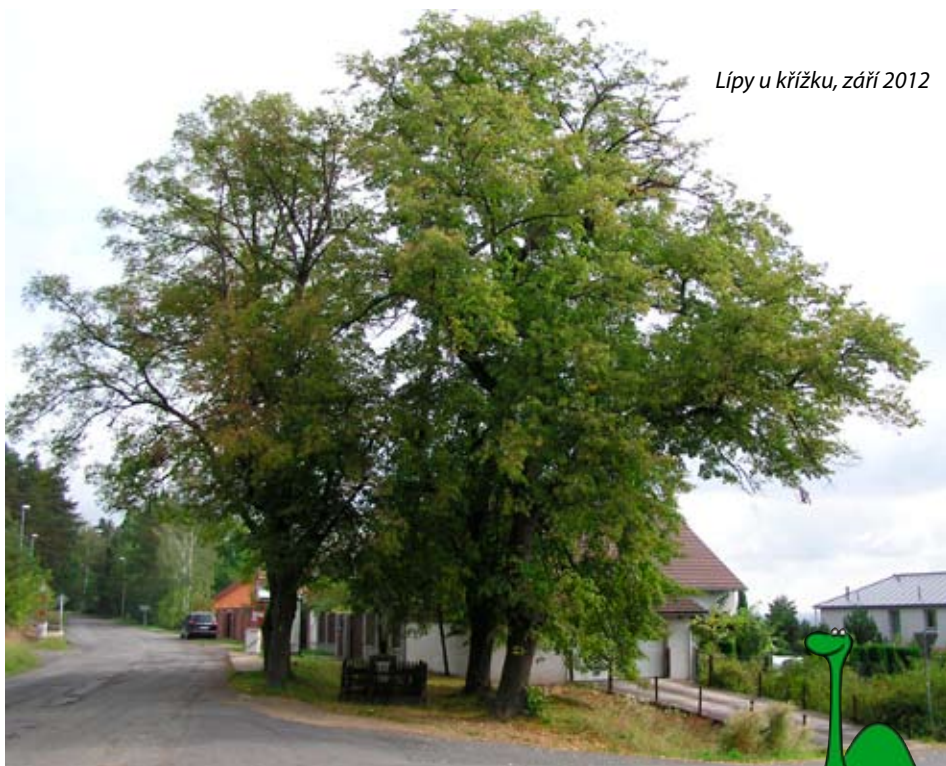
Lípy u křížku, září 2012

strom také pak grant v podobě bezplatného ošetření získal.