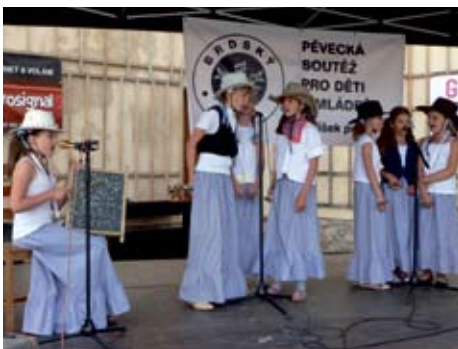
Divčí septet z Třebotova vloni zvítězil v silně obsazené čtvrté (skupinové) kategorii.

Další podrobnosti průběžně na www.mnisek.cz