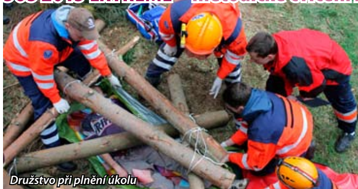
Družstvo při plnění úkolu

O zvýšený výskyt záchranářů mezi Dobřichovicemi a Mníškem pod Brdy se ve dnech 10. – 12. 5. postará pátý ročník náročného cvičení pro záchranářské týmy. Tento náročný projekt, pořádaný Asociací dobrovolných záchranářů České republiky, o. s., se do brdských hvozdů stěhuje po čtyřech letech z CHKO Slavkovský les nedaleko Karlových Varů. Nová lokalita nabízí zcela nové možnosti a velkým pozitivem je přenesení soutěže a jejích úkolů blíže k veřejnosti. Pořadatelé tak doufají ve velkou návštěvnost nejen na doprovodných progra-