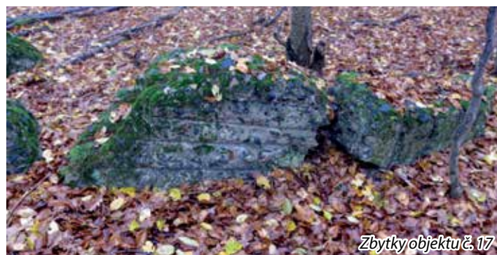
Zbytky objektu č. 17

Více informací včetně zeměpisných souřadnic všech objektů a mapy se zakreslením objektů najdete na webu www.mnisek.cz v sekci Zpravodaj.