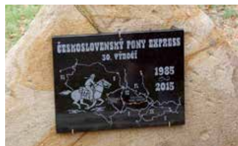
Pomník k 30 letům Československého Pony Expressu