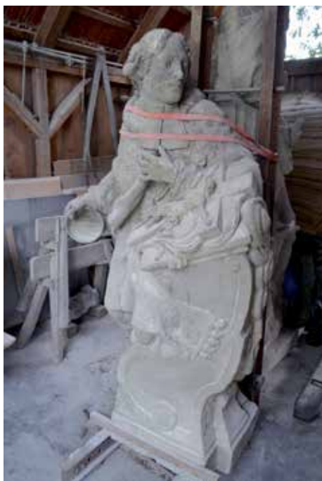
Originál sochy sv. Jana Nepomuckého

Pokud se sem dnes budou vysazovat stromy, tak je to dobře, protože to bude navázání na původní záměr, na projekt původního autora, i když není přesně znám. Myslím si, že by to mělo být obnovení v té symbolice, jak to bylo zamýšlené. V symbolice pěti hvězd sv. Jana Nepomuckého. Z člověka jménem Jan z Pomuku, člověka významného, jenž bránil královnu, se v určité chvíli stal svatý Jan Nepomucký. Ta minuta, ta vteřina, ta událost se stala pod vodou, ve Vltavě, kam bylo shozeno jeho tělo. A na hladině se objevilo pět hvězd. Jejich půdorys na hladině je jako těch pět stromů kolem té sochy. Má to hlubokou myšlenku a myslím, že by stálo za to obnovit to tak, jak to zamýšlel původní autor. Aby se to neztratilo.