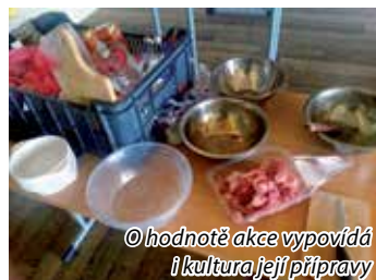
© hodnotě akce vypovídá i kultura její přípravy

Ve středu 2. září jsme přijali podnět, který se týkal podezření na nekalé prodejní praktiky. Letáky, které byly asi tři týdny před tím roznášeny do schránek, zejména na starém sídlišti, zvaly na posezení a ukázkou výrobků a služeb nového velkoskladu, zejména s potravinami a zeleninou. Takové malé, nenápadné a nic moc