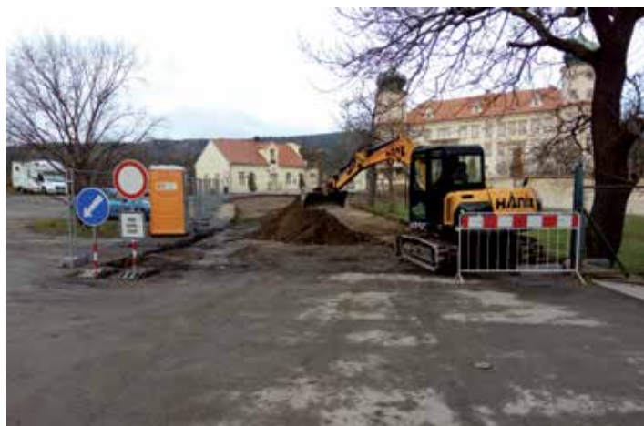
Stavbu provázejí změny v parkování