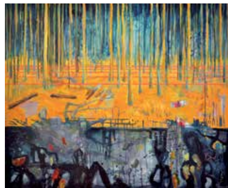
Poddolovano, akryl na plátně 130x155cm, 2011

V Paříži jsem spolupracoval s jedním maďarským umělcem, který dělá videoprojekce na loutky. Tam jsem vytvořil objekt v podobě velké kartonové budovy, kolem které mohli lidé chodit a nahlížet dovnitř, zároveň je snímaly kamery a loutky je pozorovaly zevnitř. Později mě oslovila ředitelka Sladovny, jestli bych jim v tomto duchu udělal interaktivní instalaci