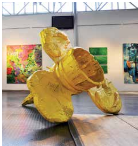
foto z výstavy v galerii Kotelna, Říčany 2015