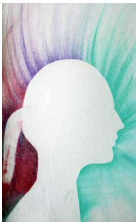
Z tvorby žákyň a žáků 7. A v hodinách výtvarné výchovy

Nově je naše škola součástí projektu Podpora společného vzdělávání i pedagogické praxi