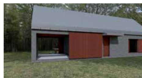
Vizualizace návrhu klubovny ze studie architekta Jana Kašpara z března letošního roku.

Darování pozemku u hřbitova s výměrou přibližně 700 metrů čtverečních považují za ideální řešení pro stavbu většího objektu, než mají v současnosti k dispozici. „Nechceme však být jen pouhými příjemci, ale rádi bychom se o svoji budoucnost ve městě také osobně zasloužili. Můžeme získat určitou část peněz ze skautského ústředí, ale