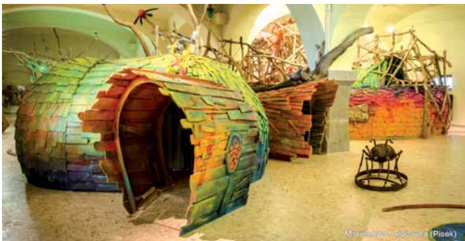
Mraveniště - interaktivní stálá expozice, Sladovna Písek