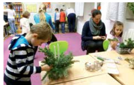
Došlo i na výrobu vánočních květináčů, truhlíků a svícňů.