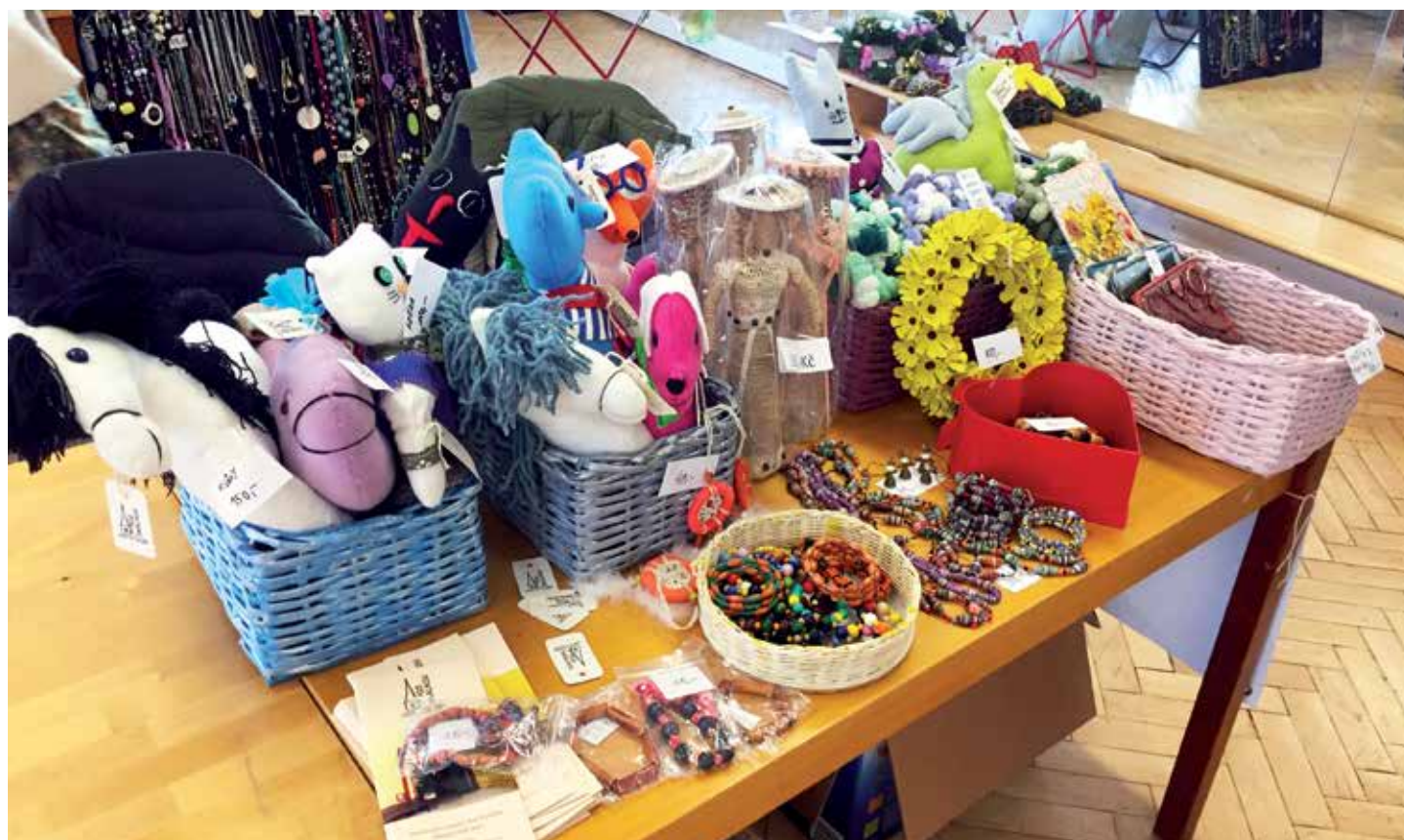
Senioři z Domečku vyrobili krásné předměty z papíru i z vlny a nabízel je na Tvořivém trhu.

Text a foto: Tereza Středová, Domov pro seniory Pod Skalkou