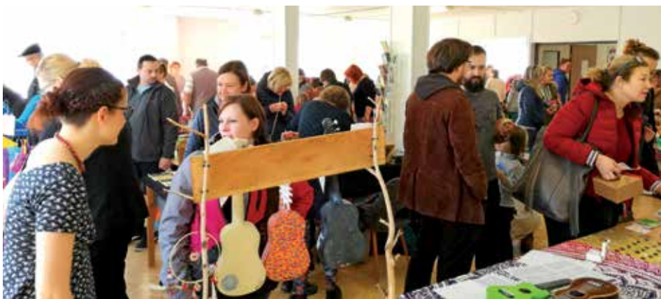
Výrobci z Mníšku a okolí nabízeli šperky, keramiku, háčkované a šité hračky, autorské kresby, malby a knihy, domácí mýdla, vánoční cukroví a mnoho dalšího.

Na svatomartinskou sobotu se prostory Městského kulturního střediska staly místem konání již třetího Tvořivého trhu, jehož ideou je především podpora místních tvořivých lidí, domácích produktů, služeb a menších podnikatelů. Své výrobky zde nabízelo 18 prodejců z Mníšku pod Brdy a blízkého okolí. Přátelskou atmosféru navíc podtrhovaly