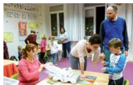
S pomocí rodičů se pustili také do výroby papírových visáček na dárky.