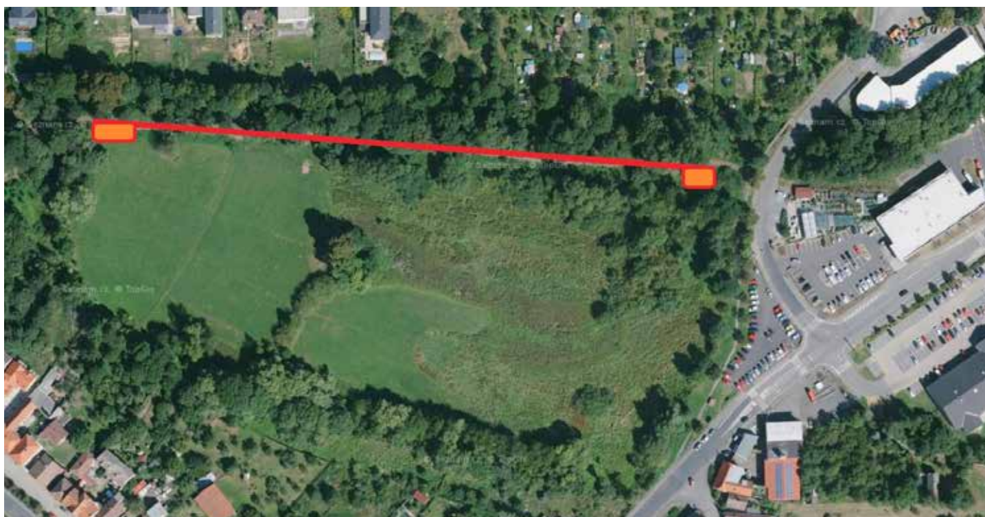
Tudy by mohla vést cyklotrasa s in-line dráhou