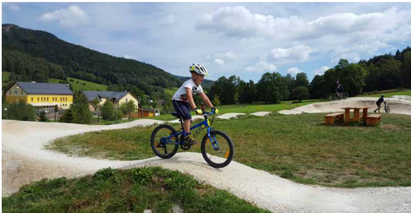
Podle jednoho z návrhů dětem chybí místo pro získávání cyklistických dovedností