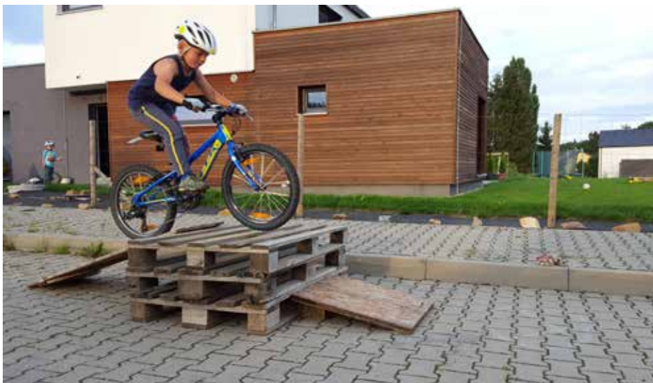
Děti baví jízda na provizorních dráhách s nenáročnými překážkami

Snaze zapojit do rozvoje města co nejvíce lidí je věnována nástěnka ve vstupní chodbě