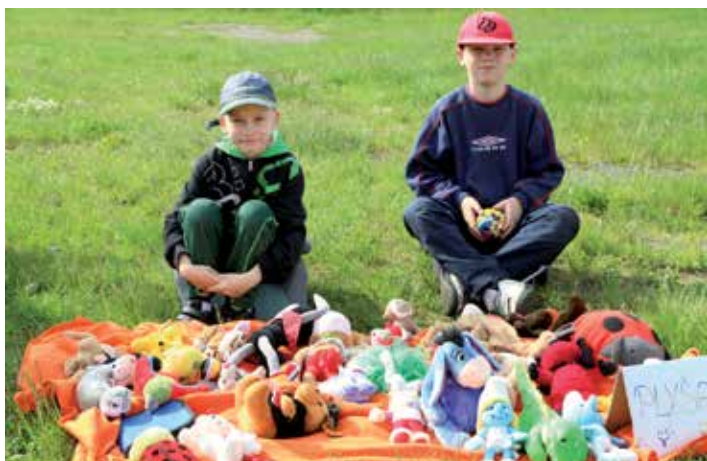
Oblíbení plyšáci čekají na své nové majitele

Výraz bleší trh pochází ze středověku, kdy panovník nebo šlechtic přechal darem oblečení svým poddaným. Ti s ním sice mohli dále i obchodovat, ale při tehdejší hygieně se tak často spolu s ním přenášeli i nejrůznější paraziti, nejčastěji blechy.