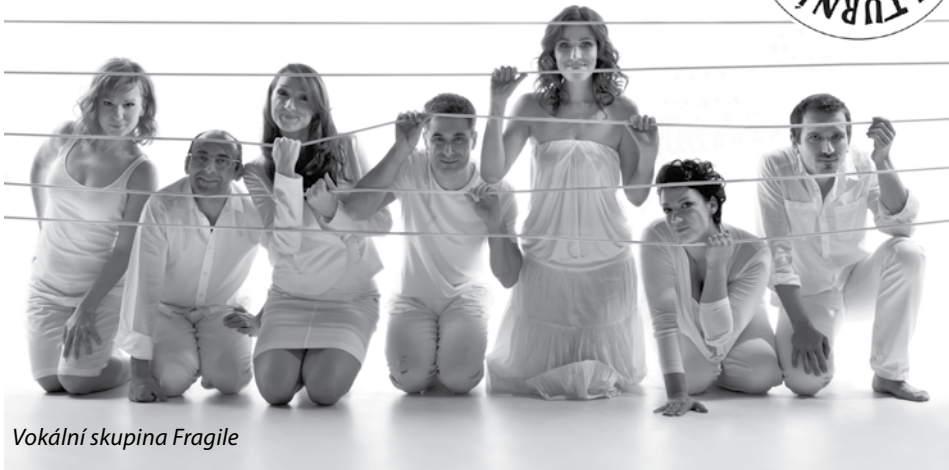
Vokální skupina Fragile

la Gotta, The Parting Glass – irská národní skladba, Get Lucky od Daft Punk, dále Fero skupiny Elán, nebo Good Old Fashion Lover Boy skupiny Queen Boy a aranže dalších známých hitů legendární britské skupiny Queen. Proto jistě zasáhnou široké divácké publikum a na své si přijdou všichni milovníci kvalitní muziky.